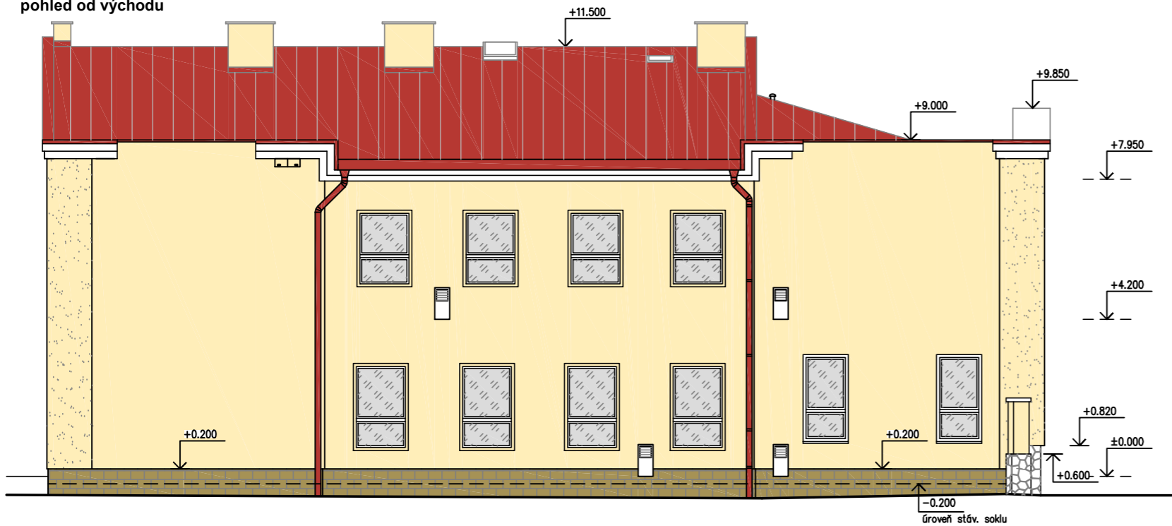
pohled od východu